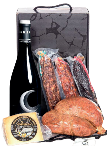
Estuche detalle embutidos y quesos Olmedo