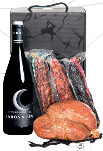
Estuche detalle embutidos Olmedo