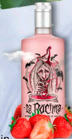
Gin PREMIUM ROSE

Elaborada en Galicia de forma artesanal, en alambiques de cobre de pequeño tamaño y con una triple destilación que garantiza su pureza y calidad.