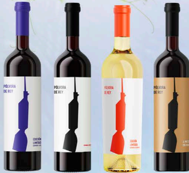
MENCIA CRIANZA BLANCO ROBLE