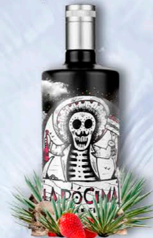
CREMA DE FRESA

Combina la suavidad cremosa del licor con los aromas frescos y fragantes de la fruta primaveral. El resultado es una bebida con un atractivo color rosáceo.