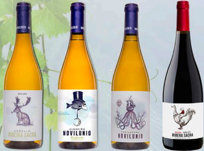
GODELLO RIBEIRA SACRA ALBARIÑO RIAS BAIXAS TREIXADURA RIBEIRO MENCIA D.O. RIBEIRA SACRA

Novilunio es una selección de las variedades procedentes de las zonas vinícolas más representativas de Galicia y, a su vez, de su principal accidente geográfico: el Río Miño. En su cauce superior, el Mencía y el Godello representan la viticultura heroica de la escarpada Ribeira Sacra. La Treixadura procede de los amables valles del Ribeiro, el vino gallego por excelencia, donde el río ya se convierte en un imponente curso de agua. Y en su desembocadura, orientado al Atlántico que tanto marca su carácter salino, el universalmente conocido Albariño del Rosal.