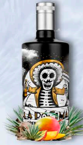
CREMA DE MANGO

Combina la suavidad cremosa del licor con los aromas frescos y fragantes de la fruta primaveral. El resultado es una bebida con un atractivo color rosáceo.