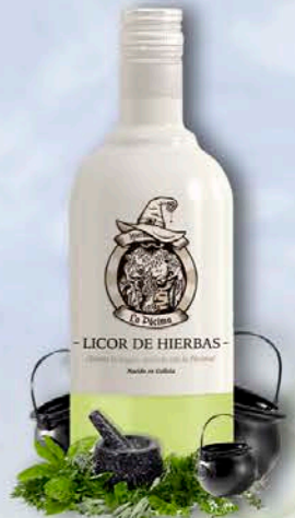
LICOR DE HIERBAS

Aúna los aromas cremosos y la canela tradicional con la suavidad que caracteriza a nuestro licor de altísima calidad. Se trata de una bebida golosa.