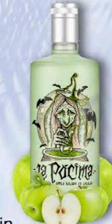
Gin PREMIUM APPLE

Una ginebra elegante, suave y divertida, elaborada con un macerado de fresas que equilibran y dan color a la mezcla.