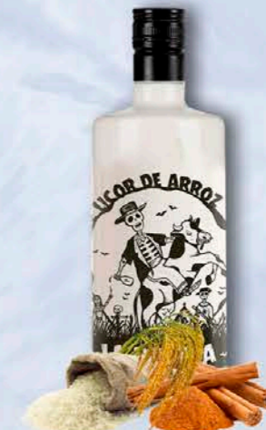
LICOR DE ARROZ

Exotismo tropical del mango. La crema de leche domina sobre el licor y se deja abrazar por la frescura ácida y dulce del mango.