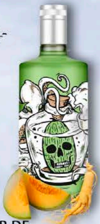
LICOR DE MELÓN-GINSENG

Nuestro macerado mezcla diferentes manzanas que aportan su frescura ácida como su apetitoso dulzor al resto de botánicos clásicos de la gama.