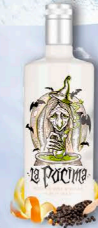
Gin PREMIUM CLÁSICA

Elaborada en Galicia de forma artesanal, en alambiques de cobre de pequeño tamaño y con una triple destilación que garantiza su pureza y calidad.